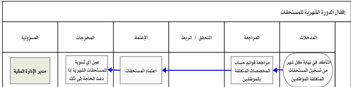
شكل رقم / ٥

يوضح المخطط البياني التالي ( شكل رقم/٥) طريقة تسلسل العمل لإقفال الدورة الشهرية للمستحقات: